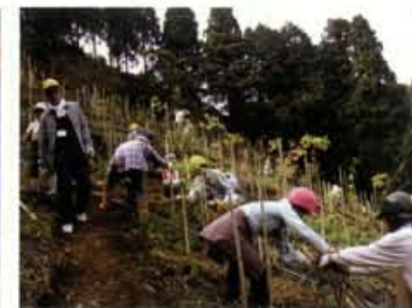
森づくり(植樹・植林)活動