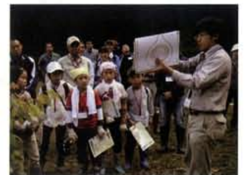
子ども達への環境教育