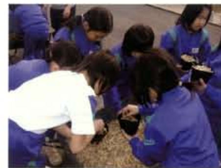
どんぐりを利用した苗作り